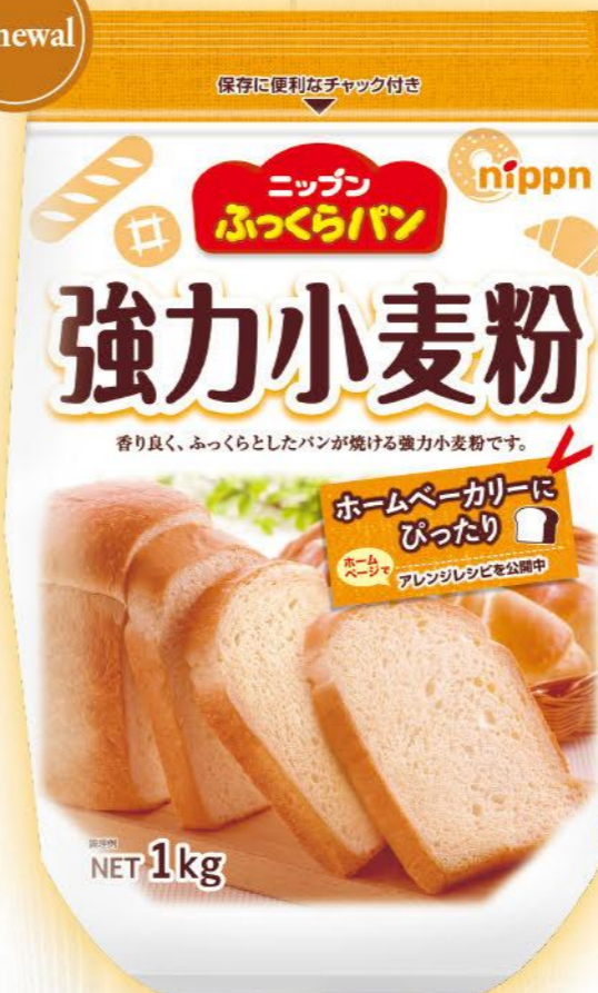
●ニッポン ふくらパン強力小麦粉 / 1kg