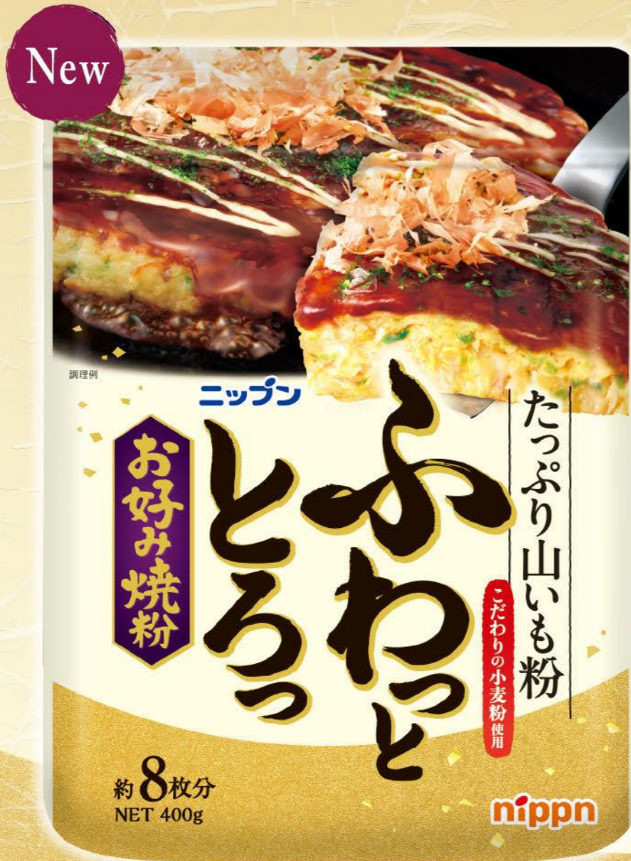
●ニッポン ふわつととろっお好み焼粉 / 400g