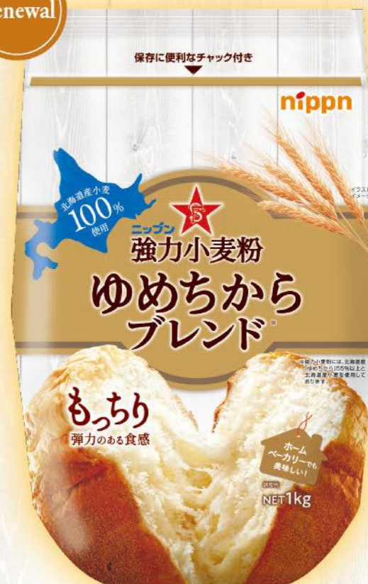
●ニッポン 強力小麦粉 ゆめちからブレンド / 1kg