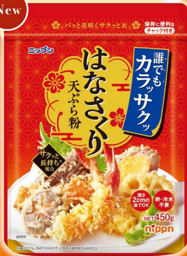
●ニッポン はなさくり天ぷら粉 / 450g