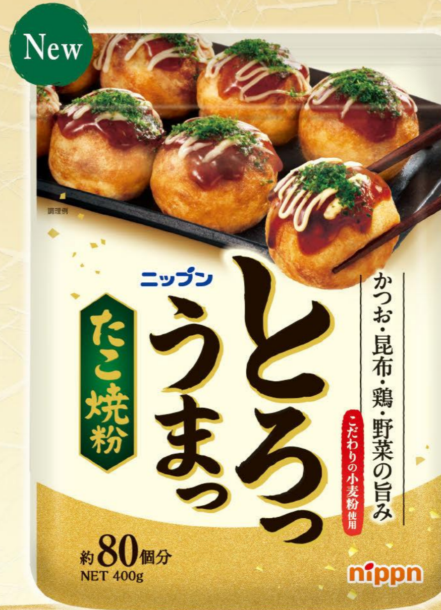
●ニッポン とろっうまったこ焼粉 / 400g