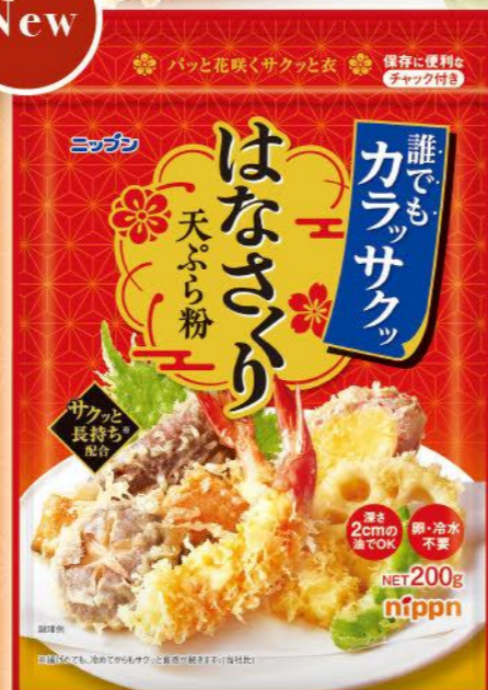
●ニッポン はなさくり天ぷら粉 / 200g